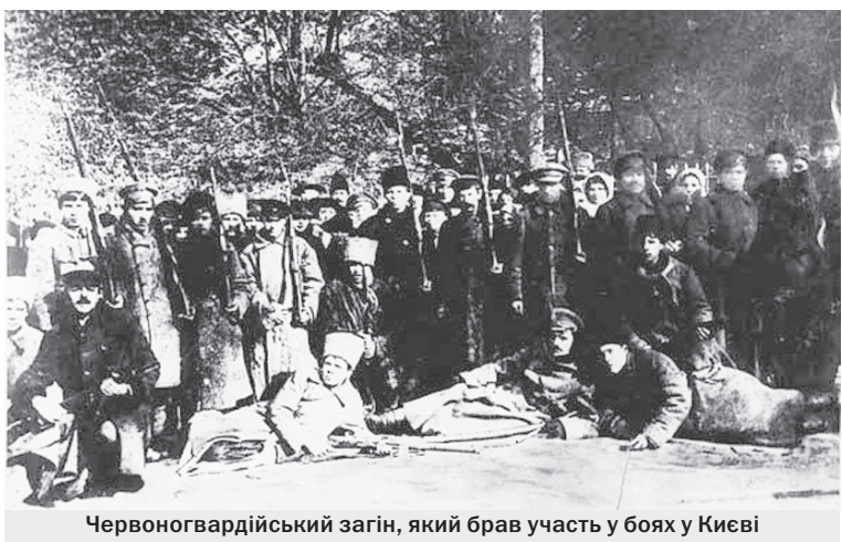
Червоногвардійський загін, який брав участь у боях у Києві

Цьому дуже раділи всі українці, кажучи, що так треба було з нею зробити і українській владі, а вона церемонилася, щоб не порушити свободи слова, і дозволяла «Кіевской Мысли» на своїх ротатійних машинах випускати десятки тисяч примірників газети, в якій щодня ганьблено, компрометовано український уряд, а сам він не мав у своїм розпорядженню жадної ротатійки і друкував свої розпорядження на плесковатих машинах, що більше десяти тисяч примірників за ніч не можуть надрукувати.