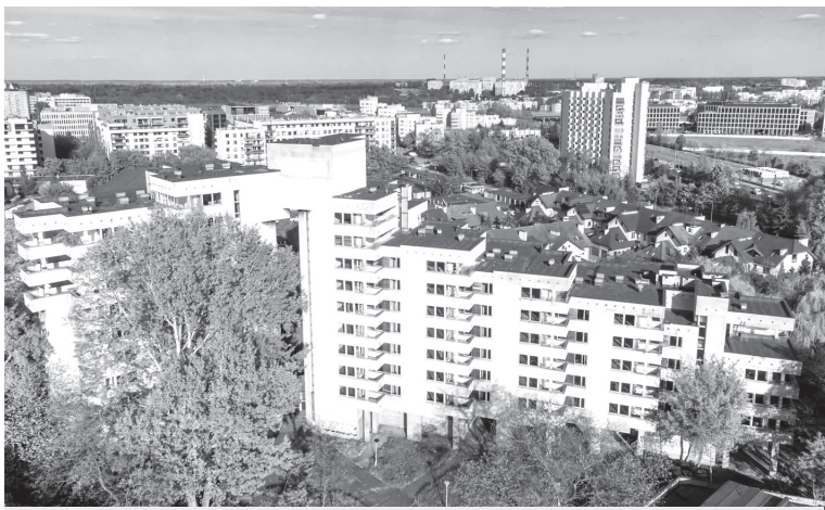
Комплекс будівель на вулиці Собеського.

У «Шпигунові» жили дипломати, але поляки не без підстав вважали кожного з них шпигуном, бо Польща була цілком залежною від советських спецслужб. На думку деяких істориків, до відновлення незалежності у 1989 році взагалі не варто говорити про польські спецслужби, можна хіба що розглядати ПНР-івські. Хоча цей термін також є неточним, оскільки назва ПНР з'явилася лише в конституції 1952 року, а тісні зв'язки між советським НКВС і Міністерством громадської безпеки Польщі тривали вже багато років.