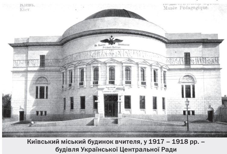
Київський міський будинок вчителя, у 1917 – 1918 рр. – будівля Української Центральної Ради

Під час бомбардировки Києва Центральна Рада наспіх радилася над есерівським законом про соціалізацію землі, а щоб врятуватись від більшовиків, постановила послати Скорописа-Йолтуховського до германського командування з проханням дозволити йому привезти з Німеччини військо з полонених українців для оборони Києва від більшовиків.