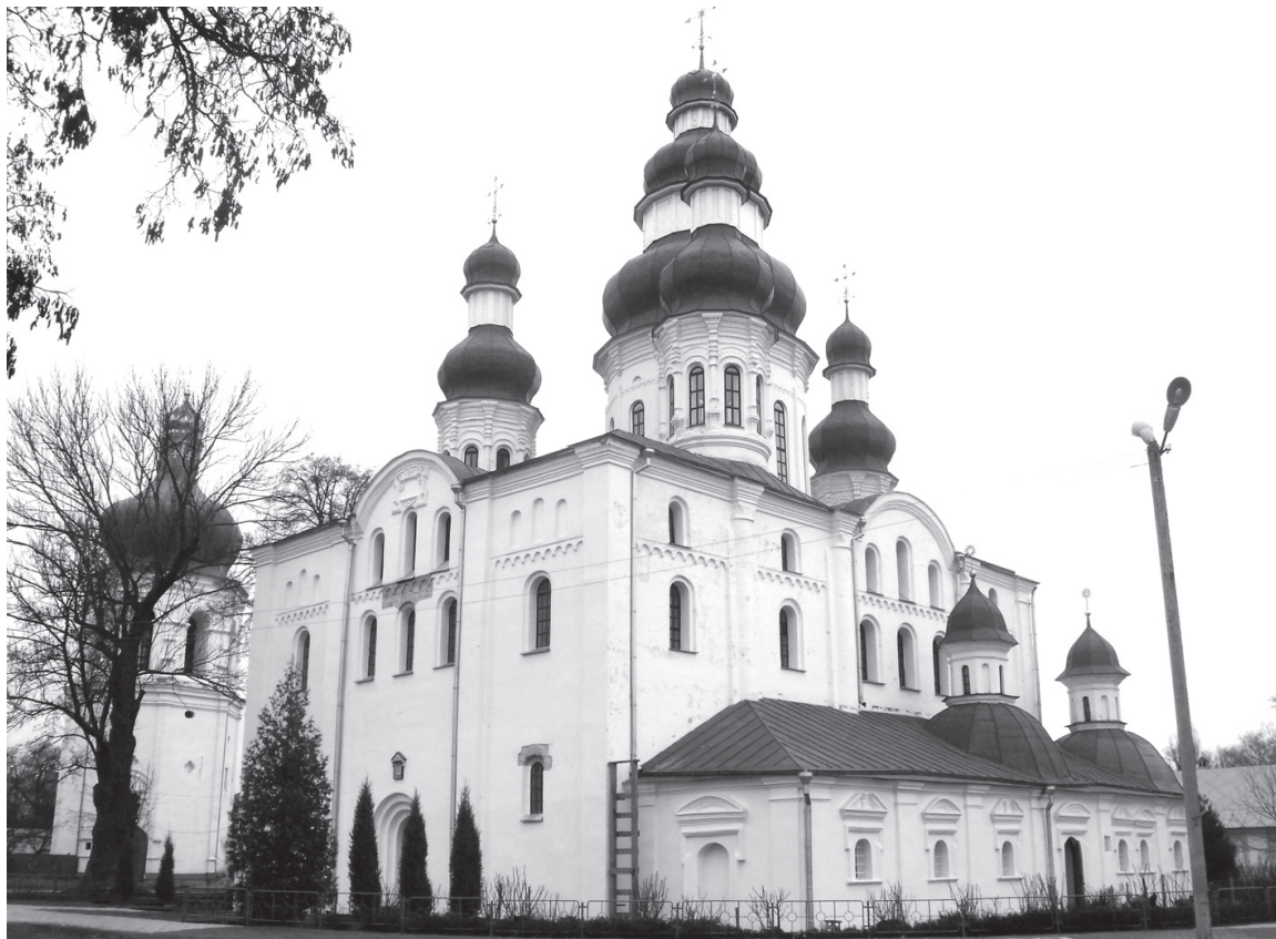
Успенський собор Єлецького монастиря сьогодні