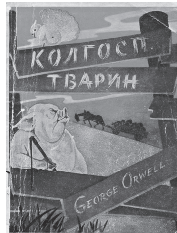
«Колгосп тварин» Джорджа Орвелла у перекладі Ігора Шевченка (пізніше відомий візантолог), видавництво «Прометей» (Новий Ульм), 1947 рік.

У Німеччині енергії Багряного вистачило на те, щоб створити свій партійний осередок – Українську революційно-демократичну партію. «Тільки звитяжні зухвальці в такий похмуру-безвихідний час можуть плянувати щось дійове, творче, масштабне» – так прокоментував це Костюк.