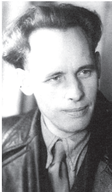
Іван Багряний (1906–1963).

Рoku 1925 19-літній хлопець опублікував першу книжку «Чорні силуети: П'ять новел» під псевдонімом Іван Полярний. На той час молодий письменник, уродженець Охтирки, здобув професію слюсаря, навчався у художньо-керамічній школі, працював і навіть встиг помандрувати. Попереду мав бути тільки Київ.