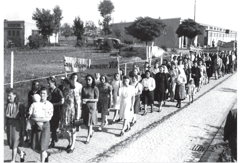
Табір Ді-Пі в Аугсбургу, 1947 рік. Акція на підтримку УПА.

Коли українська література в підсоветській Україні стала об'єктом утисків і цензурування, саме на переміщених українських авторів Багряний покладав «глибоке почуття відповідальності». А свою творчість пояснював так: «Я прибічник здорового оптимізму, прибічник творчого оптимізму, героїчного оптимізму – якого хочеться, але оптимізму здорової, молоді ще не вичерпані нації. Я прибічник життєрадісної (навіть в трагедії), самостверджуючої, пробоевої літератури». Це стосува-