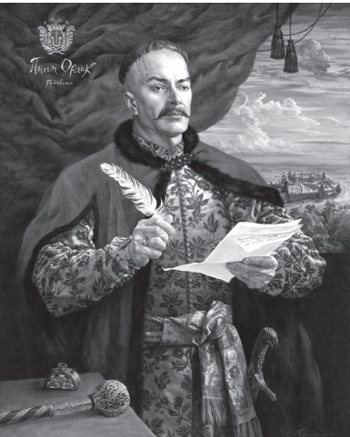
Портрет гетьмана Пилипа Орлика. Худ. Наталя Павлусенко. 2021 рік. Із фондової колекції Національного заповідника «Гетьманська столиця».

Пилип Орлик – гетьман України, провісник незалежної та демократичної держави, упорядник першої української Конституції. Він понад 30 років гетьманував в еміграції, гідно представляв питання козацької нації на європейській арені. Його тернистий шлях пролягав через сучасну Молдову, Швецію, Польщу, Грецію, Румунію. Це була довга і затьмана боротьба українського гетьмана проти московських агресорів. Тривалий час цей період історії замовчували, а Пилипа Орлика вважали зрадником.