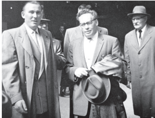
Анатолій Білоцерківський, Іван Багрянний, 1959 рік.

Схожість роману Багрянного до Кестлерового помітив також польський поет і критик Юзеф Лободовський: «Багрянний описав таку страшну дійсність, про яку Кестлерові навіть і не снилося. А все ж таки «Тьма опівдні» є книжкою понурою і гнітючою, натомість «Сад Гетсиманський» – не біймося цього банального вислову – з почуттям духового підсилення. Що страшніші речі діються у книжці, то більшу віру викликано в читача».