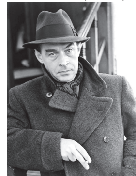
Еріх Марія Ремарк, письменник німецького спротиву

Переважає більшість невідома навіть нинішнім громадянам Німеччини (за винятком істориків, літературознавців та філологів, звичайно). Можна зайти, наприклад, у ту саму вікіпедію і переконатися: невідомі особи, зовсім невідомі. Єдине, чим вони залишилися в історії – тим, що підписали цю «клятву», а потім у своїх текстах прославляли нацистські ідеї. Їх усіх давно немає в живих – останній підписант помер 1995 року.