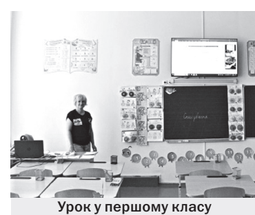
Урок у першому класі

– Молодці, продовжуйте писати! Але в класі нікого нема. Парти порожні. Не одразу помічаю великий екран над дошкою, де в маленьких віконечках першокласники випишують літери аж налігши на зошити.