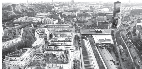
Проект дерев'яного району у Стокгольмі виглядає дуже сучасно

Архітектори прогресивно включили у конструкції природні елементи – наприклад, зелені дахи для кращої ізоляції та великі вікна, що пропускають природне світло, втілюючи наше бачення міста, яке процвітає у гармонії з природою.