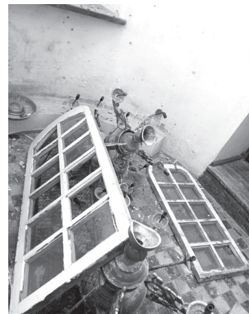
Пошкоджені внаслідок обстрілу 16 березня 2022 р. два вікна у східній вітальній абсиді Іллінської церкви. XI – поч. XII ст. м. Чернігів

Руйнування Чернігова та його пам'яток, спричинені авіаційними нальотами та артилерійськими обстрілами німецьких та радянських військ, зафіксовані на світлинах 1940-х років. Фактично вони виступають свідками минулого і показують ті трагічні сторінки, які пережило місто протягом 1941 – 1943 років. Унікальні фотодокументи були зроблені різними людьми, але серед багатьох інших можна