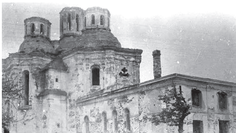
Зруйнована Катерининська церква (вигляд з заходу). 1941 – 1943 рр.

Зазнали руйнувань та ще більшої шкоди від вогню архівні установи міста, які тоді знаходилися у приміщеннях Архієрейського будинку на Валу та Катерининської церкви. В храмі внаслідок бойових дій були пошкоджені частина склепін, барабани бань та внутрішнє оздоблення. В будівлі, яку і сьогодні займає Державний архів Чернігівської області, під час пожежі вигоріли більшість дерев'яних перекриттів та був значно пошкоджений дах. Після війни були плани повної перебудови споруди із надбудовою третього поверху, однак, на щастя, комісія визнала, що це буде фінансово недоцільно. За повідомленнями