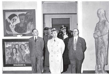
Відвідування Геббельсом виставки «Дегенеративного мистецтва», 1937 рік.

У свою чергу, письменники-антифашисти чинили опір нацистському режиму, його ворожості до мистецтва і культури, його підготовки до війни, а далі – безпосередньо до війни. Письменники-антифашисти не були переконані, що нацисти повернуть захоплену ними владу, як тільки війна закінчиться, літератори стверджували, що лише у випадку, якщо всі противники Гітлера діятимуть спільно та солідарно, буде шанс знищити нацистську диктатуру. Самі письменники, які були налаштовані різко проти Гітлера, зазнавали всіх можливих поневірянь: на них писали наклепи, їх позбавляли громадянства, майна та грошей, їм не давали публікуватися як в періодиці, так і видавати свої книги.