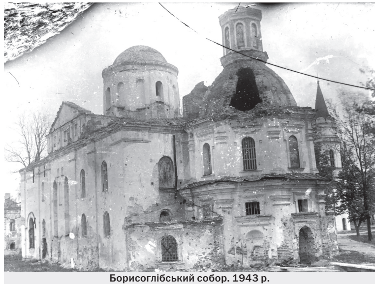
Борисоглібський собор. 1943 р.