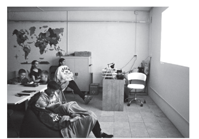
Діти в освітньому центрі

Ідею з подібними просторами фонд втілює у декількох школах Чернігова, а також у школах області, зокрема й двох прикордонних селах, які у березні опинилися на лінії фронту,