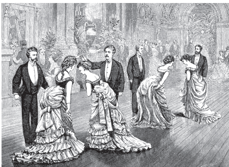
Котильйон. Ілюстрація з танцювального керівництва. XIX ст.

подорож з Парижу до Варшави й Кракова, через всю Європу. По дорозі новий король давав безліч балів та прийомів. На вибори короля, а пізніше на його коронацію, зі всієї великої країни прибуло понад 50 тис. делегатів, серед яких й було багато українських князів, магнатів та шляхти. Після цього мода на справжні французькі наряди, музику, бали, танці поширилась всією державою.