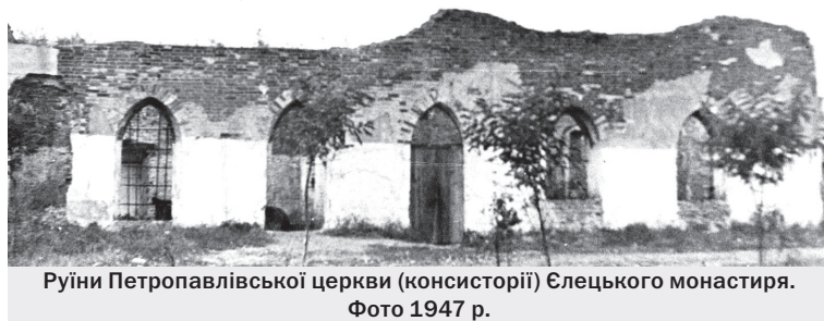
Руїни Петропавлівської церкви (консисторії) Єлецького монастиря. Фото 1947 р.

Значно менше протягом війни були пошкоджені комплекси колишніх Єлецького та Троїцько-Іллінського монастирів. Так, на території першого з них, внаслідок аварії радянського літака 1943 р., зазнав руйнувань верхній ярус монастирської дзвіниці. Згідно з описом стану споруд за 1947 рік, зазнали суттєвого пошкодження від пожежі споруди Успенського собору та колишньої Петропавлівської церкви XVII ст. (консисторії). Остання на момент початку війни вже знаходилася в незадовільному стані, а події війни лише довершили її подальше руйнування.