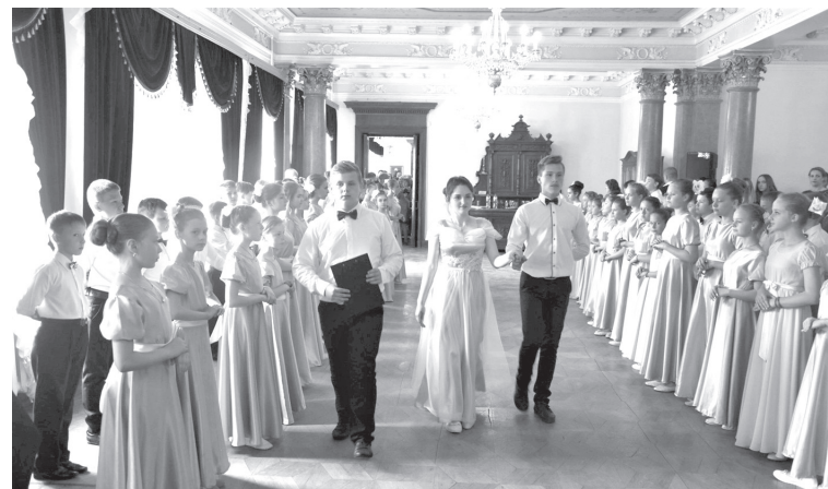
Дитячий благодійний бал «На гостини до Тарновських». НІКЗ Качанівка, 25.05.2019 р.

В одному з літописів тих часів зберігся опис вбрання гетьмана Івана Мазепи, в якому він з'явився на козацькому балу, що влаштувала княгиня Ганна Дольська: «Мазепа на балу мав на собі темно-зелений каптан із товстої китайської матерії, оброблений золотом, який йому служив кунтушем. На його грудях кріпилося п'ять золотих петлиць, покритих діамантами, всередині були смарагди та рубіни. Під каптаном, підшитим малим атласом, одягнуто жупан із срібної парчі. Його стягував пасок, вельми гарний і багатий, з гронами з дрібних перлин. На ноги взуто жовте взуття, на голові вбрано бобріву шапку з оксамитовим дармовішем пурпурового кольору. Шю його прикрашала посаджена шпонка