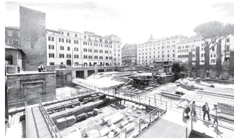
оглядовий майданчик коштуватиме €5.

Від 20 червня відвідувачі можуть пересуватися територією новою пішохідною доріжкою. Для іноземних туристів вхід на