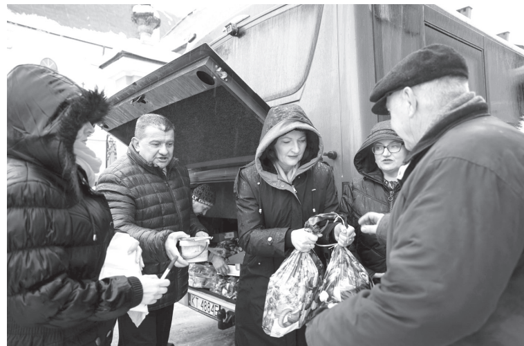
Анджей Берестецький і воєвода Підкарпатського воєводства Єва Ленарт передають гуманітарну допомогу мешканцям українського містечка.

Детальніше про участь воєводства в допомозі мені