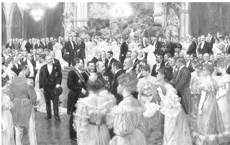
Вільгельм Гаузе. Бал. 1904 р.

В Україні мода на класичні французькі бали поширилась, коли майбутній король Франції Генріх III Валуа, син Катерини Медичі, був обраний (в 1573 – 1574 рр.) королем Речі Посполитої, Великим князем Литовським, Українським, Мазовецьким, Київським, Волинським, Подільським і т. д. У 1573 році він здійснив двомісячну