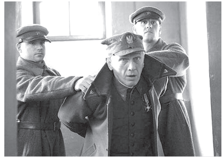
Батько видатного режисера польського і світового кіно Анджея Вайди, польський військовополонений, також був розстріляний під Катинню. Режисер присвятив батькові і всім жертвам злочину свій фільм «Катинь» (кадр з фільму).

Катинь – назва, спеціально обрана з пропагандистською метою. Одноименне село було розташоване поруч, але не найближче до поховань, виявлених німцями 1943 року. Цю назву тепер вживають як збірну для всіх епізодів розстрілу за-