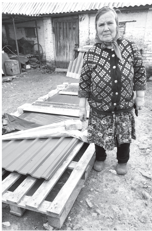
Кошти ТУМ виділено також на відбудову зруйнованих боями будинків мешканців Куликівської громади на Чернігівщині

Товариство Української Мови з поміччю української громади в діаспорі плянує надалі допомагати народові України не тільки словом, а і ділом!